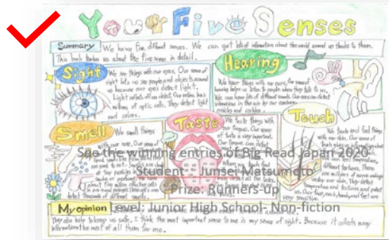
YES 橫向海報色調角度正常