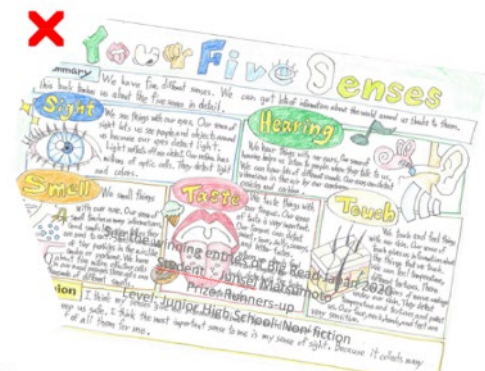
NO 海報傾斜且部份內容被裁切