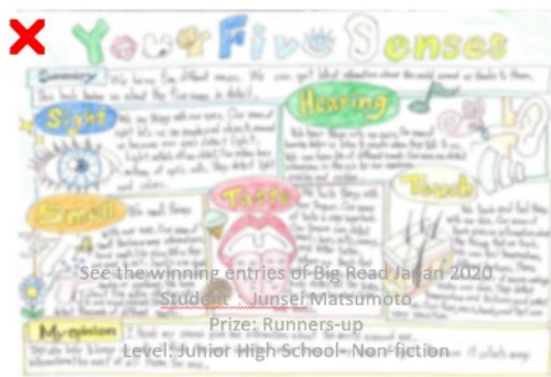
NO 解析度不足，無法辨識內容