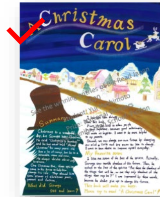
YES 直向海報色調角度正常