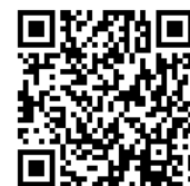
木匠的家粉絲專頁

木匠的家成立於 1999 年，並於 2004 年增設「木匠的家公益二手店」。透過回收民眾家中淘汰的家具、物品，並雇用弱勢朋友進行修復及協助販賣，至今已修復數萬件家具，提供 225 名弱勢朋友工作機會，更輔導了將近百人重回職場就業。