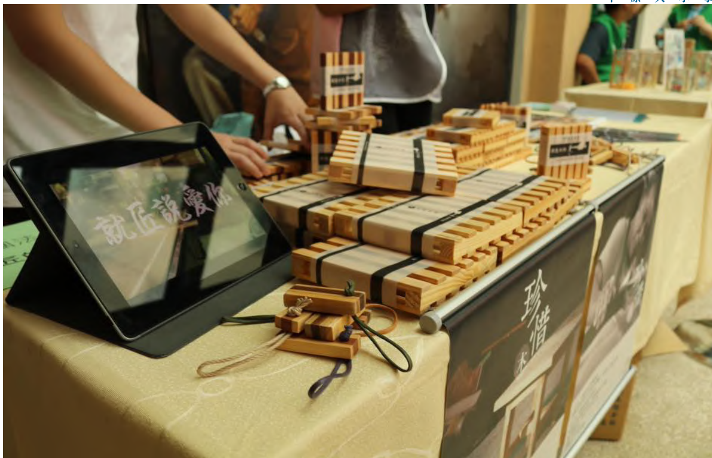
01 販售拼木杯墊的市集現場