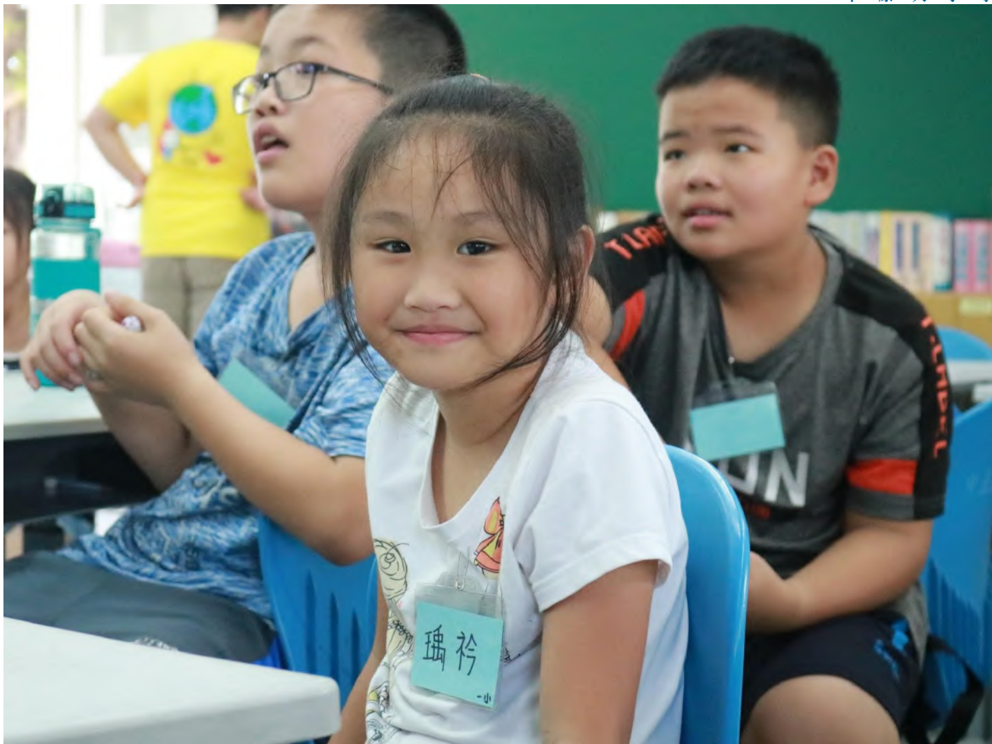
01 108年暑期營隊小朋友