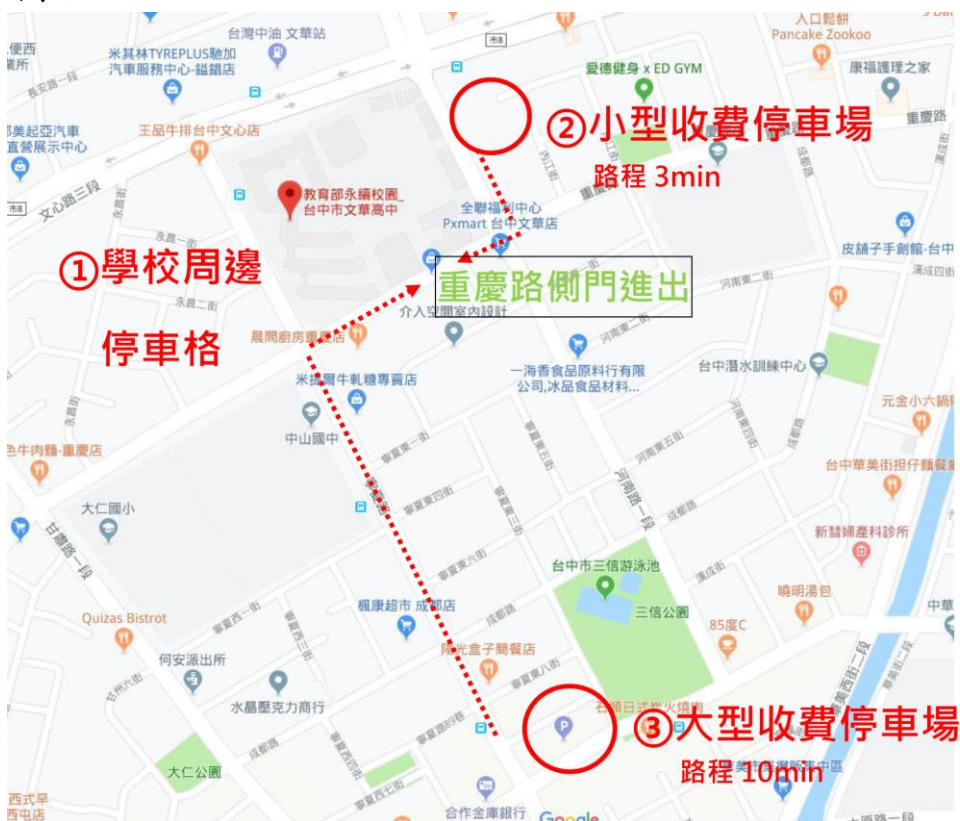
圖一：文華高中周邊停車場位置圖

建議確定出席之老師們，參考以下臺中市立文華高中學校周邊停車場及美術教室一研習場地圖示。