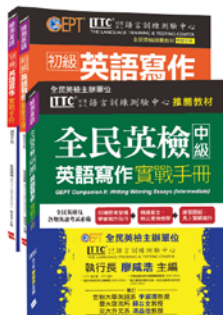
《初級英語寫作實戰手冊》 《中級英語寫作實戰手冊》 【定價】$320